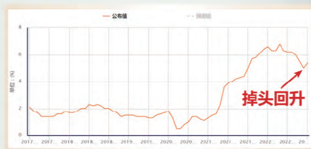
图1，美国PCE数据年率（数据来源：汇通网）

现在我们来谈一下有什么因素可以推动金价重上2010大关。自1950年以来，美联储共计10次去通胀，其中8次出现